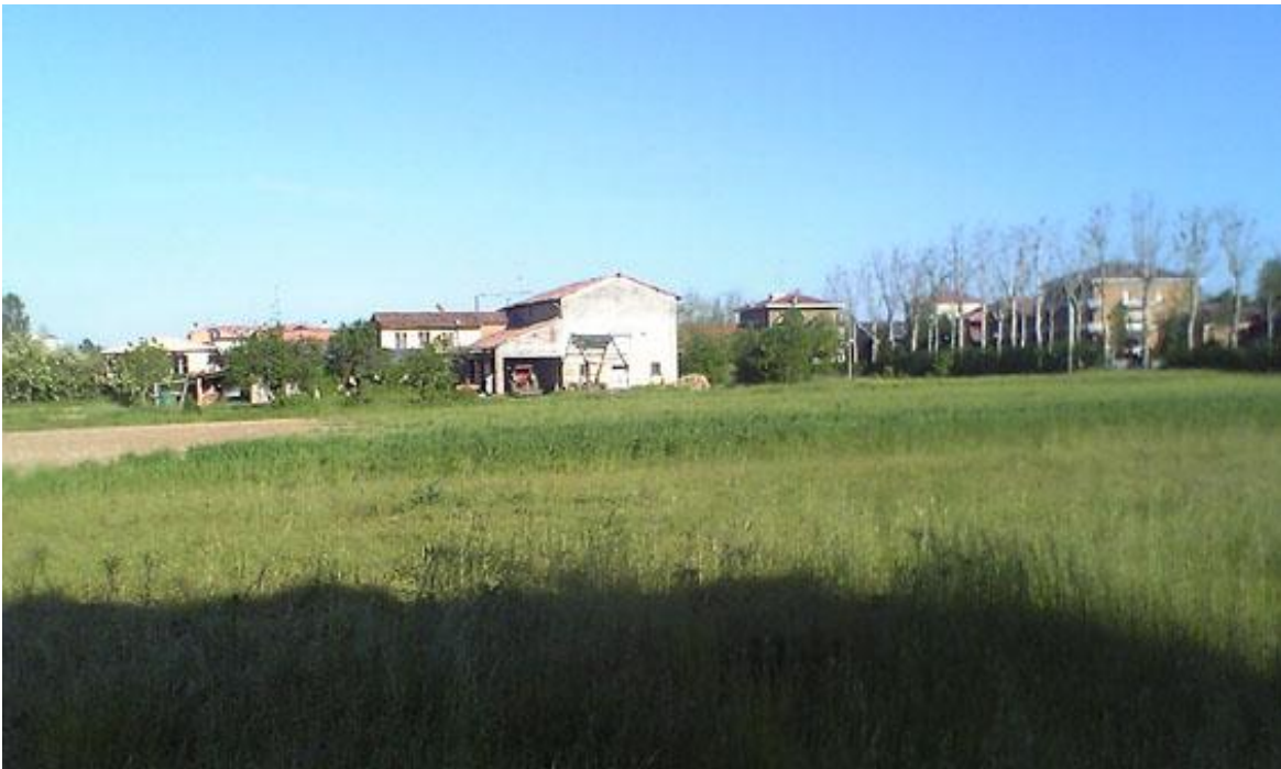
Figura 6 - VISTA N°4 VERSO EST