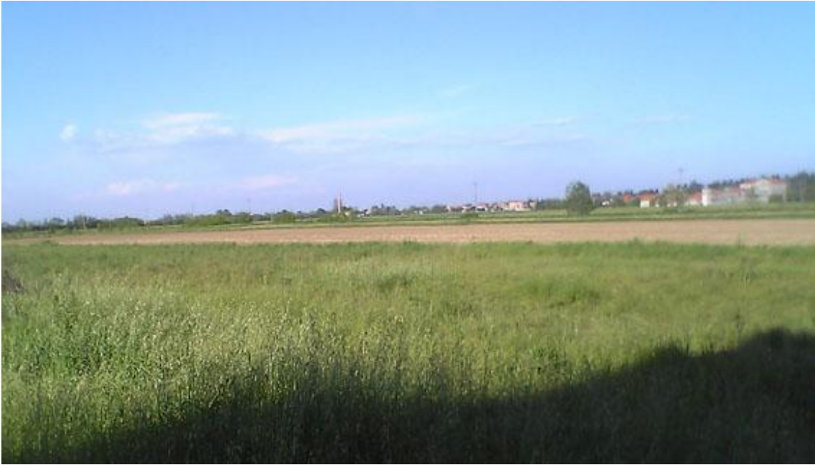
Figura 5 - VISTA N°3 VERSO NORD/EST