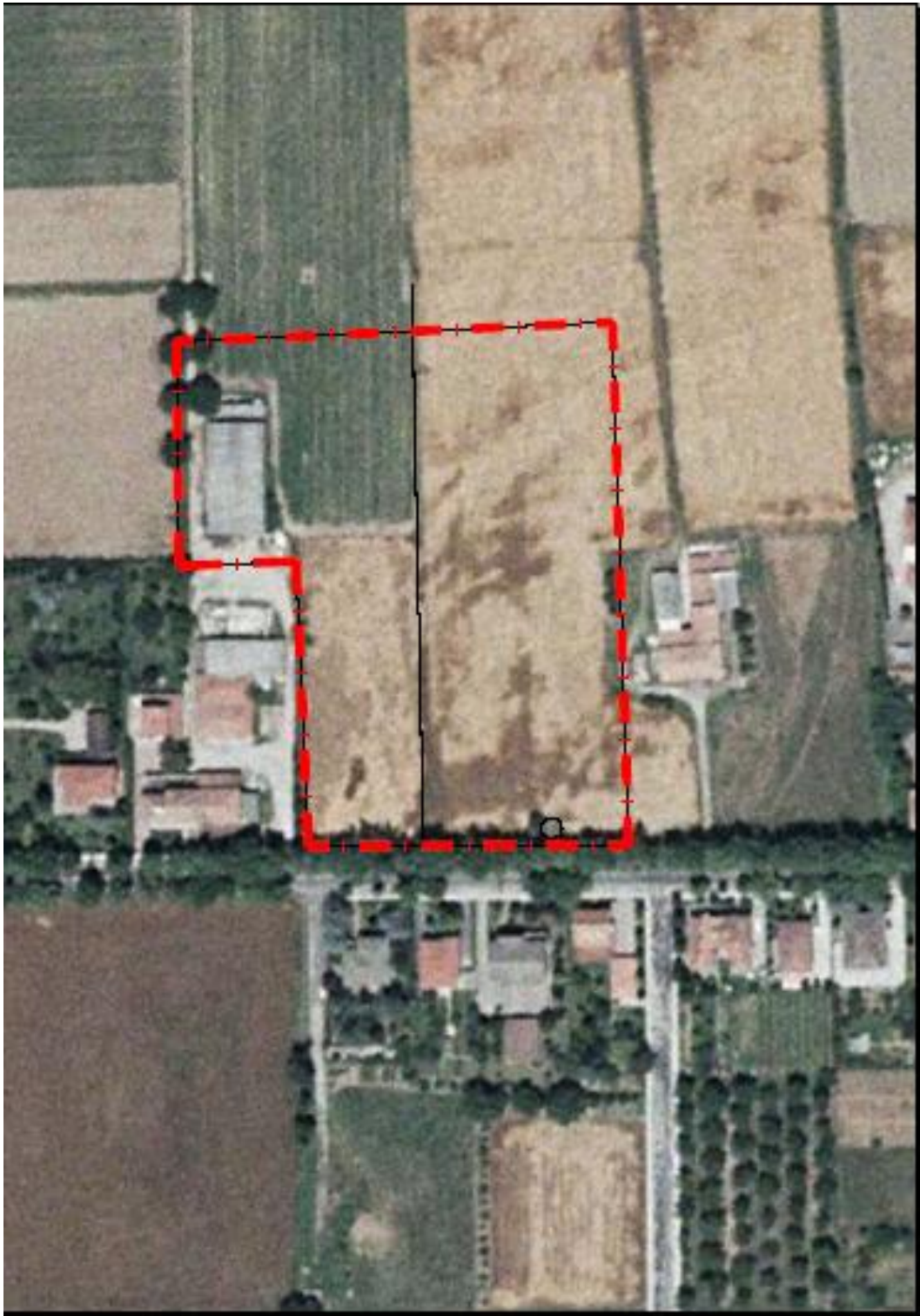
Figura 1 - Foto aerea