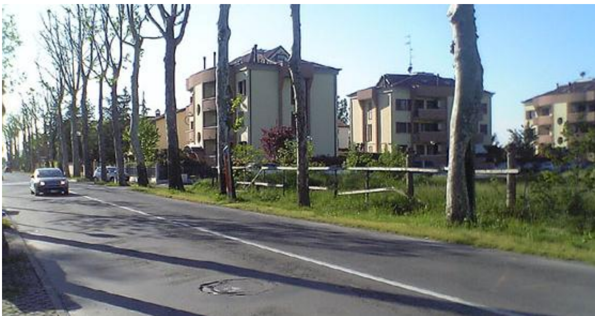
Figura 8 - VISTA N°6 IN DIREZIONE OVEST SUL VIALE MARCONI