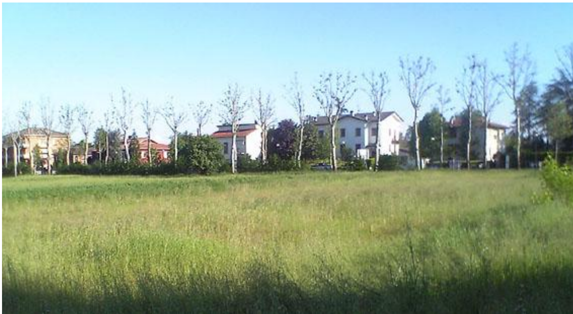
Figura 7 - VISTA N°5 IN DIREZIONE SUD (viale Marconi)