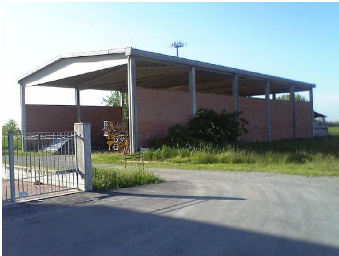
Figura 3 - VISTA N°1 VERSO NORD/OVEST (fabbricato in demolizione)