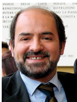
Vittorio Gallese, neuroscienziato

VITTORIO GALLESE è professore di fisiologia umana presso l'Università di Parma. Le sue ricerche vertono sulla relazione tra percezione dell'azione e conoscenza. In questa prospettiva è giunto, assieme ai colleghi del gruppo di Parma, all'identificazione dei cosiddetti «neuroni specchio», il che lo ha portato a elaborare un approccio interdisciplinare alla questione dell'intersoggettività e della conoscenza sociale. Ha pubblicato numerosi lavori su prestigiose riviste scientifiche internazionali quali «Science», «Neuron», «Trends in Cognitive Sciences», «Journal of Cognitive Neuroscience», «Cognitive Neuropsychology», «Philosophical Transactions of the Royal Society».