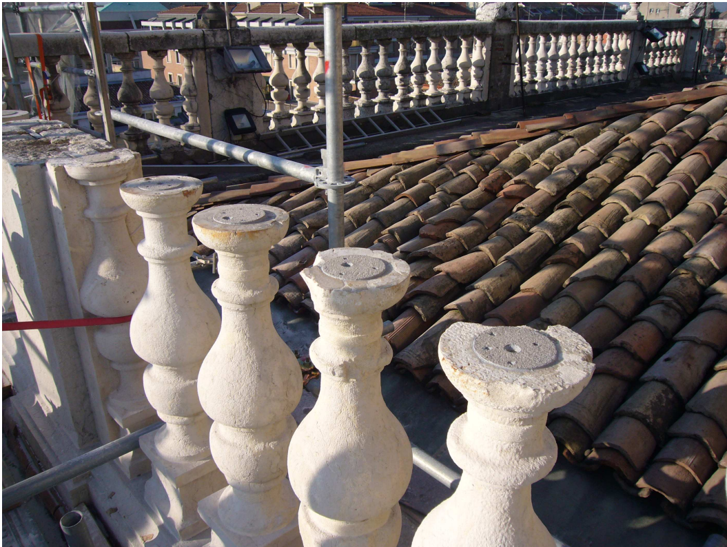
La Basilica di Santa Maria della Steccata: colonnini della balaustra sottoposti a restauro.