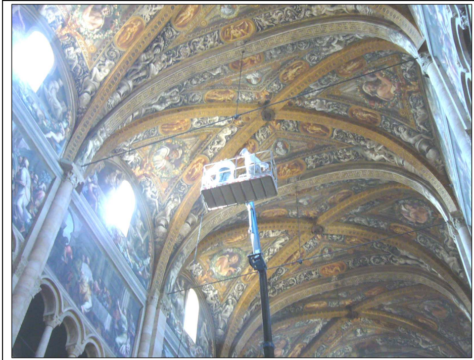
Foto della navata centrale della cattedrale durante l'esecuzione delle prove dinamiche da parte dei tecnici del Dipartimento di Ingegneria Industriale dell'Università di Parma. Si nota chiaramente come le volte e gli arconi trasversali abbiano perso la loro forma originaria ad arco di cerchio, risultando oggi fortemente ribassati; nella foto sono visibili anche le catene poste all'imposta degli arconi.