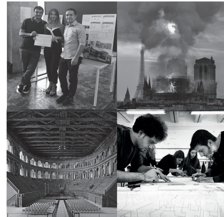
Tavola Rotonda sulla "Didattica per il Restauro"