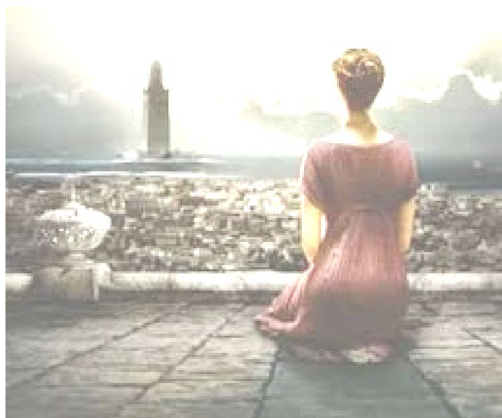
Ipazia, filosofa matematica astrologa (Alessandria d'Egitto 370-415 d.C.)

Azienda Ospedaliero-Universitaria Via Gramsci, 14 PARMA